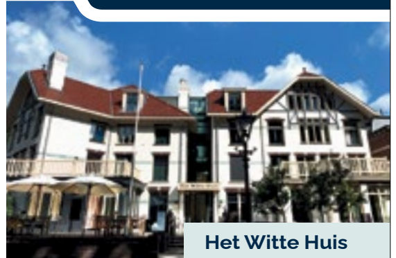
Het Witte Huis