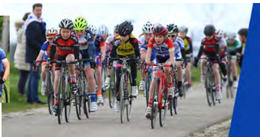
KNWU jeugdwielrennen in de categorieën 1 t/m 7 en nieuwelingen (15/16 jaar)