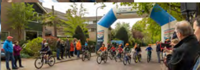
Dikke bandenraces voor de plaatselijke en regionale schooljeugd